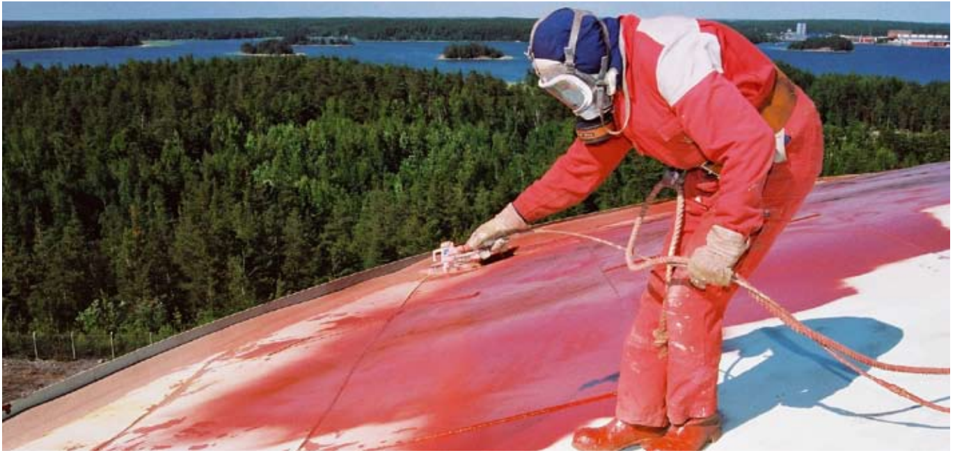
Нанесение Temabond ST 300 на ранее окрашенную поверхность (ремонтная окраска)

но поверхности, создают барьер, препятствующий проникновению агрессивных веществ к подложке. Краски с использованием других пигментов легко пропускают воду и другие вещества, в то время как в покрытии с алюминиевыми пигментами каплям агрессивных веществ приходится буквально прокладывать путь, обходя одну чешуйку алюминия, только для того чтобы наткнуться на другую. Ряд исследователей пришли к выводу, что низкая газопроницаемость, в частности кислорода, обеспечиваемая чешуйками алюминия, значительно улучшает эксплуатационные свойства покрытий на основе эпоксидных мастичных красок на заржавленных поверхностях.