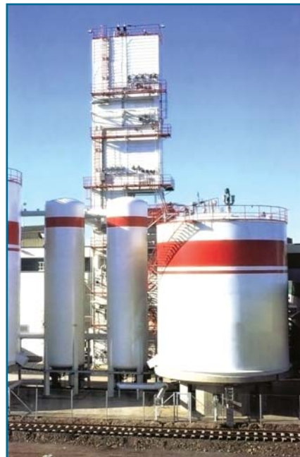
Рис. 3. Высокоэффективная защита бункеров и танков достигается за счет использования эпокси-полиуретановой системы покрытия.

Применяемые системы ПК показали отличные результаты в процессе лабораторных испытаний и в условиях эксплуатации.