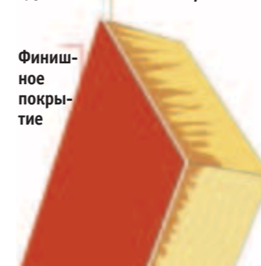
Трехслойная система окраски промышленными покрытиями Tikkurila

Пропитка глубоко проникает в древесину, препятствуя образованию плесени и гнили, грунтовка защищает древесину своими пигментами от губительного действия УФ-излучения. Финишное покрытие придает деревянной поверхности цвет и глянец. Атмосферостойкость системы была подтверждена результатами испытаний Российского испытательного центра ЗАО «ИЦ ВНИИГС».