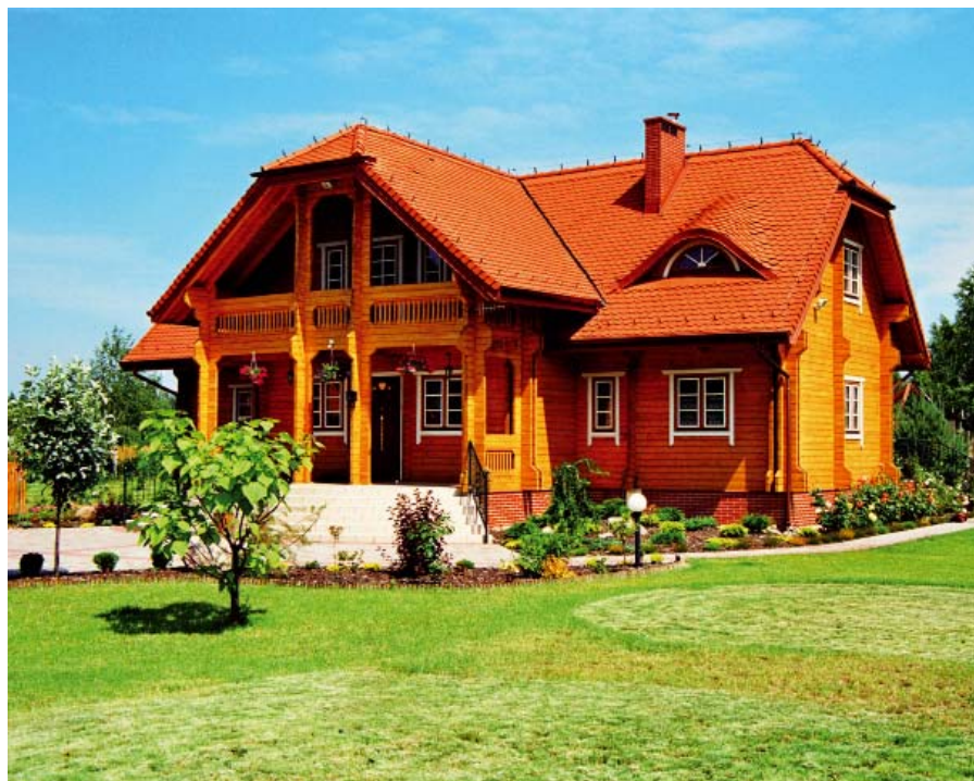
Рис. 3. Благодаря своим несомненным достоинствам водоразбавляемые материалы Tikkurila Coatings широко применяются в коттеджном строительстве в Европе и начали продвигаться на российский рынок.

Pinja W-Oil – масло для обработки наружных деревянных поверхностей: террас, уличной мебели и т. д.