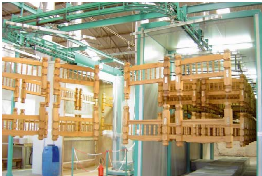
Рис. 2. Водоразбавляемые материалы Tikkurila Coatings экологически безопасны и могут применяться в производстве детских кроваток.

отделки. Обработке могут подвергаться как различные наружные поверхности – террасы, облицовочные панели, садовые инструменты, так и находящиеся внутри помещения – мебель, стены, потолки.